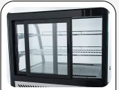
Porte scorrevoli posteriori