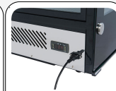
Basamento in acciaio inox con controllore digitale