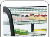
Luce LED interna